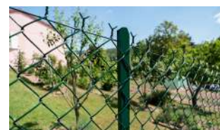
P.14 - Grillages simple torsion