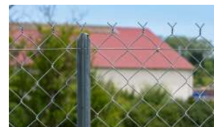
P.50 - Poteau Té