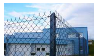
P.52 - Cornière L