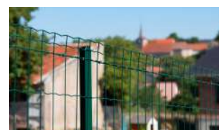
P.30 - Grillages soudés